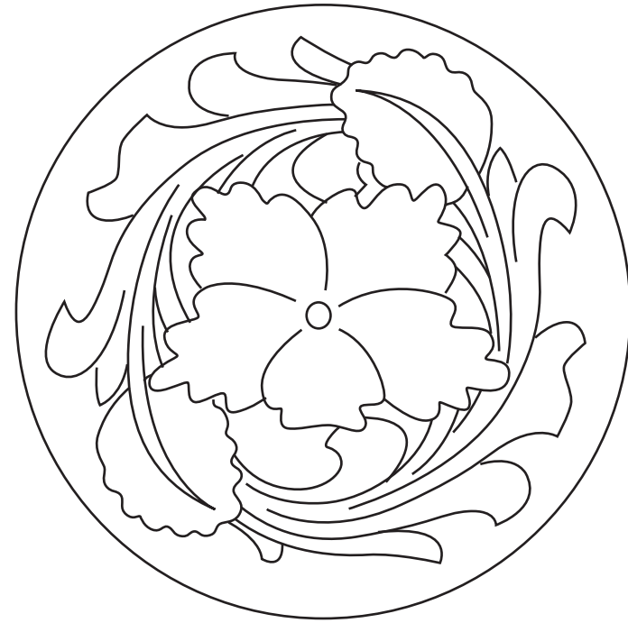
シェリダスタイル